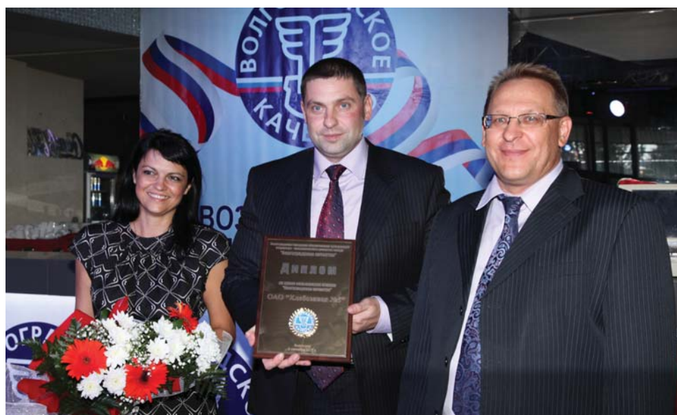
Вручение диплома «Волгоградское качество»

Небольшой текст о том, что комиссия попробовала плюшки, убедилась в качестве и т. д. Небольшой текст о том, что комиссия попробовала плюшки, убедилась в качестве и т. д.