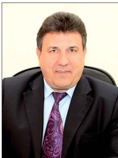
Галушкин Василий Иванович заместитель Главы Администрации Волгоградской области по промышленности и торговле, Председатель ВРОО «Волгоградское качество»