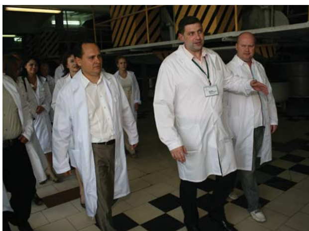
Подпись к фото