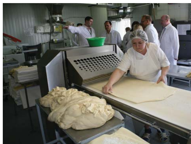
Подпись к фото

Небольшой текст о том, что комиссия попробовала плюшки, убедилась в качестве и т. д.