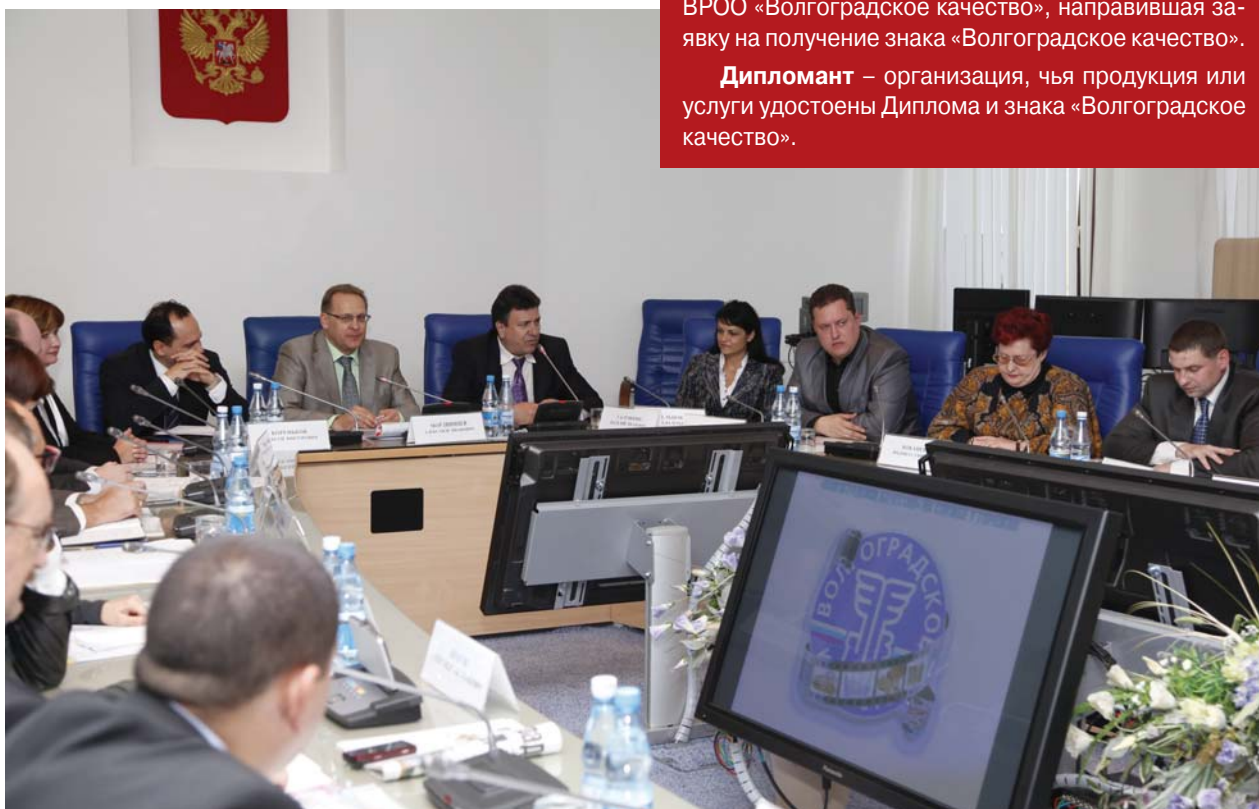
Рассмотрение комиссией заявки...

Дипломант – организация, чья продукция или услуги удостоены Диплома и знака «Волгоградское качество».